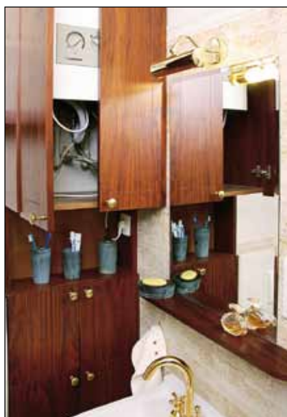
Kotel je elegantně ukryt za dvířky závěsné skříňky.