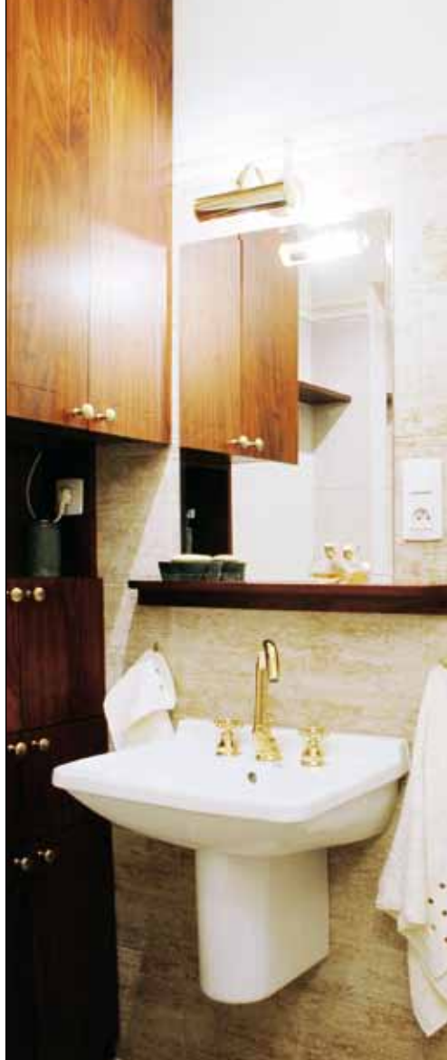
Koupelna může konečně získat přívlastek komfortní. Zvětšil se prostor sprchového koutu, stěny dostaly nový obklad imitující přírodní kámen, instalovala se nová sanita. Nezapomnělo se ani na zdánlivé detaily, zlaté armatury, které stylovému zařízení sluší více než chromové.

prahu koresponduje s výmalbou zdí, jedná se o fungující, působivý a přitom finančně nenáročný detail.